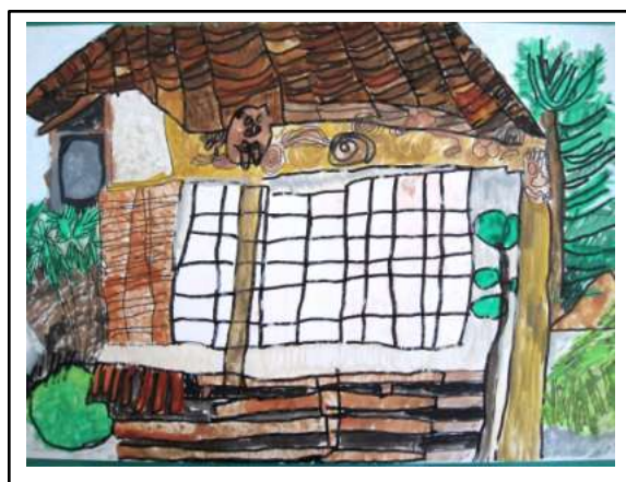
3年 脇蘭 泰楽「潮見寺」