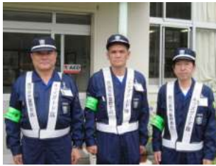
【キッズガード隊の方々】