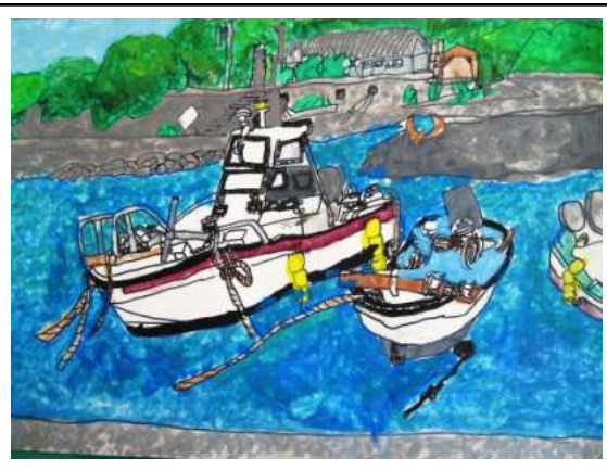
4年 手打 慎太「西方の海」