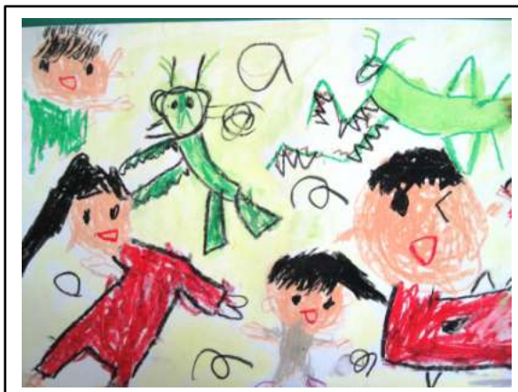
1年 汐満 玲央「バッタとあそんだよ」